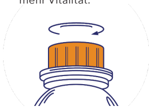
Schritt 1: Kappe öffnen