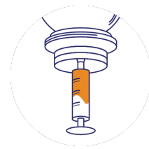
Schritt 3 : Mit einer Deckel aufziehen, sodass die gewünschte Menge für die Spritze an der Öffnung vorhanden ist