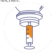
Étape 3 : Mit einer Deckel aufziehen, sodass die gewünschte Menge für die Spritze an der Öffnung vorhanden ist