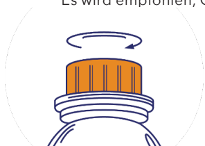
Schritt 1: Kappe öffnen

Es wird empfohlen, Cavalor LaminAid mit einer Spritze direkt ins Pferdemaul zu verabreichen.