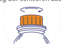
Schritt 1: Öffnen Sie die Flaschenverschluss

Tipp: Cavalor Bronchix Pulmo ist auch als Flüssigprodukt erhältlich. Die Zusammensetzung ist identisch. Ideal für den langfristigen Einsatz. 20 ml pro Tag an mindestens 6 aufeinanderfolgenden Tagen (Erhaltungsdosis) oder 15 aufeinanderfolgenden Tagen (bei starker Belastung), 30 ml am Tag vor einer schweren Ladung, 30 ml am Tag der schweren Last (oder in der Nacht zuvor). Maximal 60 ml pro Tag.