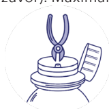
Schritt 2: Schneiden Sie den mittleren Teil des Stopfens so ab, dass eine Öffnung für die Spritze vorhanden ist