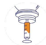
Schritt 3: Ziehen Sie die gewünschte Menge mit der Spritze ab