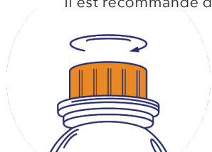
Étape 1 : ouvrez le bouchon

Il est recommandé d'administrer Cavalor LaminAid à l'aide d'une seringue, directement dans la bouche.