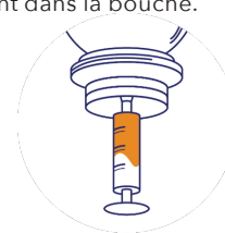
Étape 3 : aspirez la quantité souhaitée à l'aide d'une seringue.