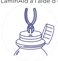
Étape 2 : découpez la partie centrale de l'opercule afin de créer une ouverture pour la seringue.