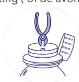
Stap 2: Knip het middelste deel van de plug zodat er een opening is voor de spuit