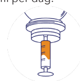
Stap 3: Trek met de spuit de gewenste hoeveelheid op